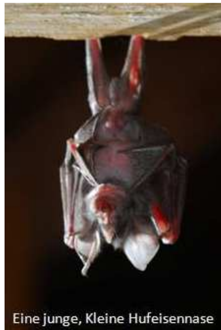
Eine junge, Kleine Hufeisennase