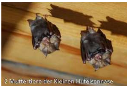
2 Muttertiere der Kleinen Hufeisennase

Ort: Hainzenberg Gasthof Dörfllwirt Datum: Dienstag, 13.10.2009 Zeit: 20:00 Uhr (Ende ca. 21.30 Uhr)