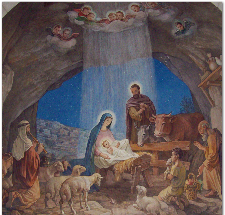
Fresko in der Kapelle bei den Hirtenfeldern in Beit Sahour bei Betlehem

Wir wünschen allen Gemeindegewinnen und -bürgern ein gesegnetes Weihnachtsfest und ein glückliches und erfolgreiches Jahr 2018!