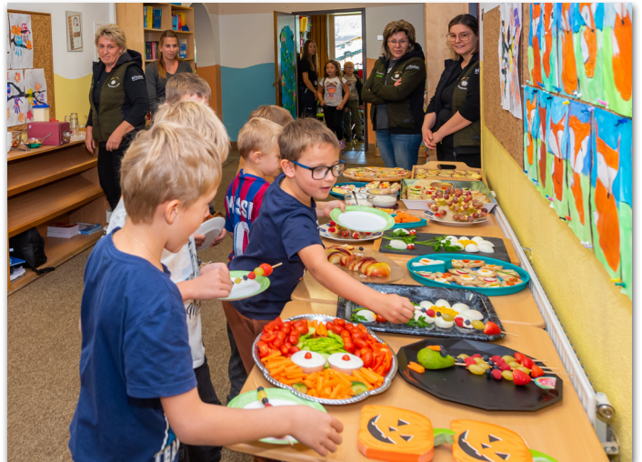
Die Bäuerinnen verwöhnten die Volksschüler mit einer gesunden Jause.